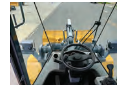
Cabine com ar-condicionado, ar quente e incêndio e para-sol inclusos.