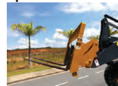
Garfo de carregamento de engate rápido.