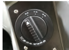
Seletor de faixas de trabalho com 3 modos de operação (econômico, normal e força total). Com economia de até 15% de combustível.