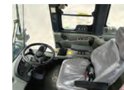
Coluna de direção com ajuste de altura e rebatimento. Assento ajustável com frio, ROPS/FOPS; Ótima visão para amortecimento bidirecional, apoio de braço e trabalho. Porta copo, extintor de suspensão.