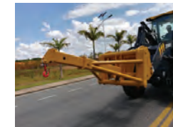
Braço de movimentação de materiais de engate rápido.